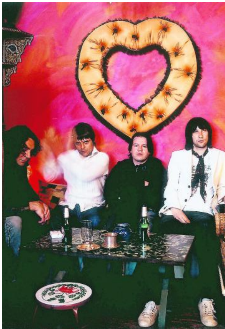
Imagen de Primal Scream.