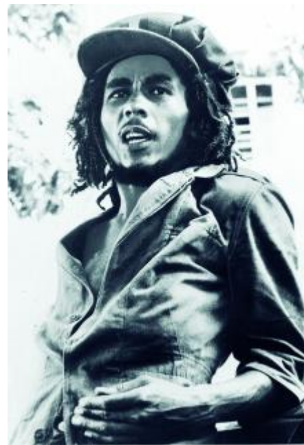
Bob Marley.