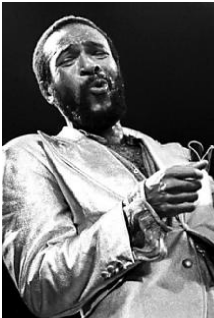
Marvin Gaye.