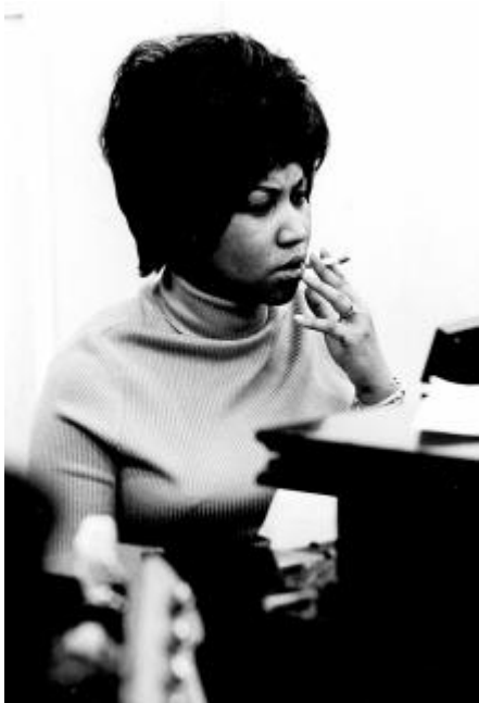
Aretha Franklin.